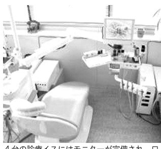
4台の診療イスにはモニターが完備され、口腔内の写真やCT画像をその場で見られます。

このことで、自宅に居ながら、歯科医院に行くのと同様の治療が受けられます。「毎週、火曜日に行なっております。寝たきりの方や、病気等で通院が困難な方は、気軽にお電話いただければ、ご相談のうえご訪問の日時を決定いたします」とのことです。幼児から老後まで総合診療の歯科医院です。